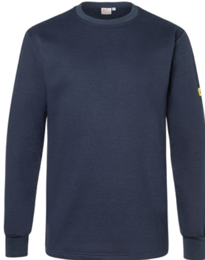
Dunkelblau 5314 5384-48 XXS-4XL