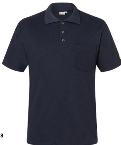
Dunkelblau 5312 5383-48 XXS-4XL