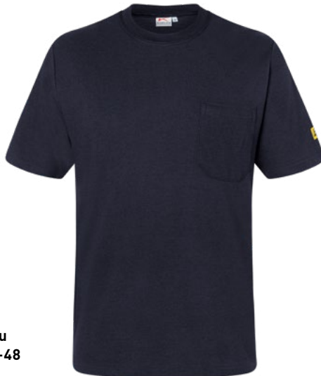
Dunkelblau 5310 5383-48 XXS-4XL