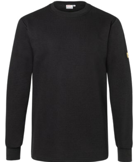
Schwarz 5314 5384-99 XXS-4XL