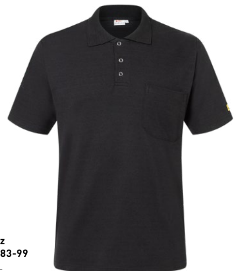
Schwarz 5312 5383-99 XXS-4XL