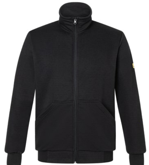
Schwarz 5316 5384-99 XXS-4XL