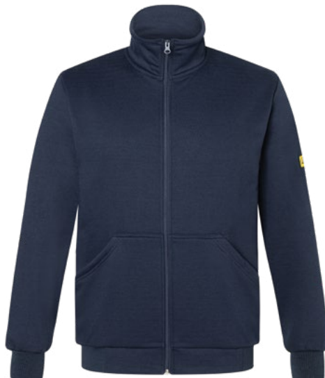
Dunkelblau 5316 5384-48 XXS-4XL