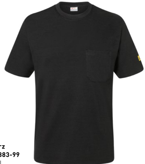
Schwarz 5310 5383-99 XXS-4XL